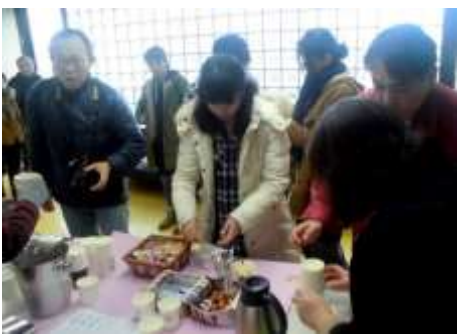
写真左： 札幌ワイズのコー ヒーとキャンデー サービスカウン ターです。「行列ので きるお店」でした。