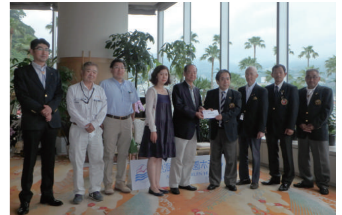
〔台中クラブ王陸谷 Y's から熊本地震義援金を受け取る〕