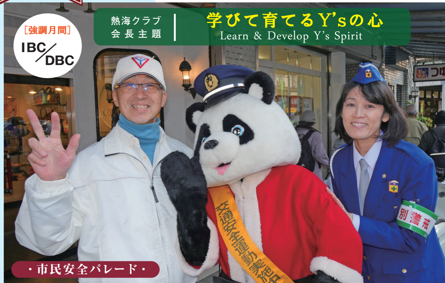
・市民安全パレード・